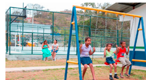
Niños utilizan parque de juego