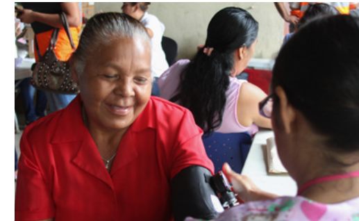
Control de presión arterial