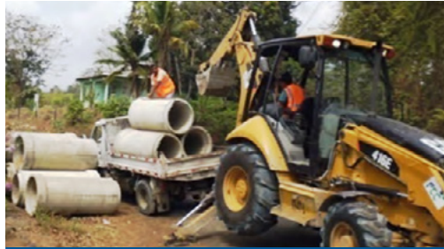
Donación de tubos de concreto para reparación de alcantarillas

Con estas actividades FCC refuerza el compromiso que siempre ha tenido para con las comunidades.