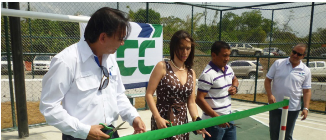
Inauguración de Cancha de Juego

Para FCC los niños forman parte fundamental de la sociedad, es por esto que ofrecer un lugar de sano esparcimiento es un compromiso que esta empresa adquirió con la comunidad 19 de Abril, donde se construyó una cancha de usos múltiples y un parque infantil en las inmediaciones de la cantera La Valdeza, en el distrito de La Chorrera.