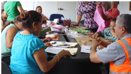
Personas de la comunidad participando en el taller de modistería