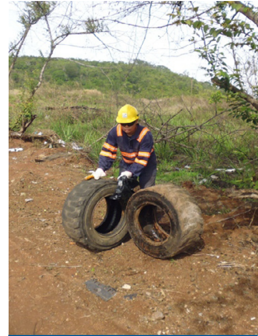
Trabajadores de FCC apoyaron en la recolección

para esto todos deben poner de su parte.