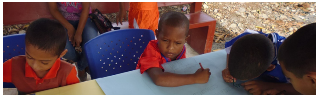
Niños de la comunidad confeccionan pancartas de Guadalupe