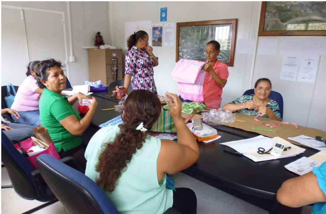
Taller de modistería en integrado por vecinas de la comunidad

Al final del curso se premiará la persona más puntual y a la más destacada con una máquina de coser para cada una, para que puedan iniciar un negocio de modistería en sus hogares y ser fuentes de ingreso para sus respectivas familias.