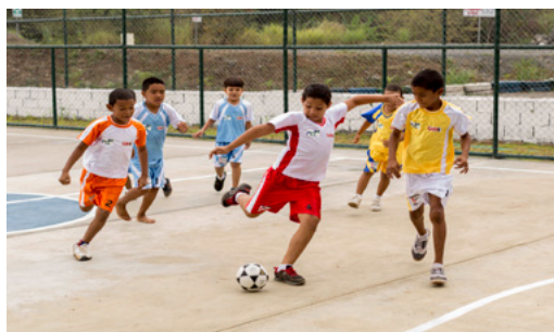
Primera Liga de futbol infantil

Este centro deportivo que está construido de cemento y cercado completamente para mayor seguridad de los que ahí asisten, se realizó con una inversión que alcanza los 50 mil dólares.