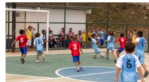
Primera Liga de futbol infantil