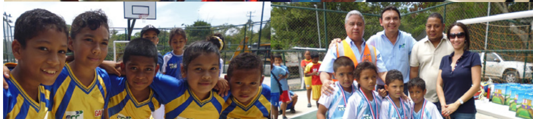
Los niños se divirtieron y compartieron