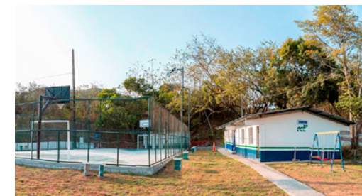
Cancha multiusos y parque de juego

en beneficios de las comunidades cercanas a los proyectos.