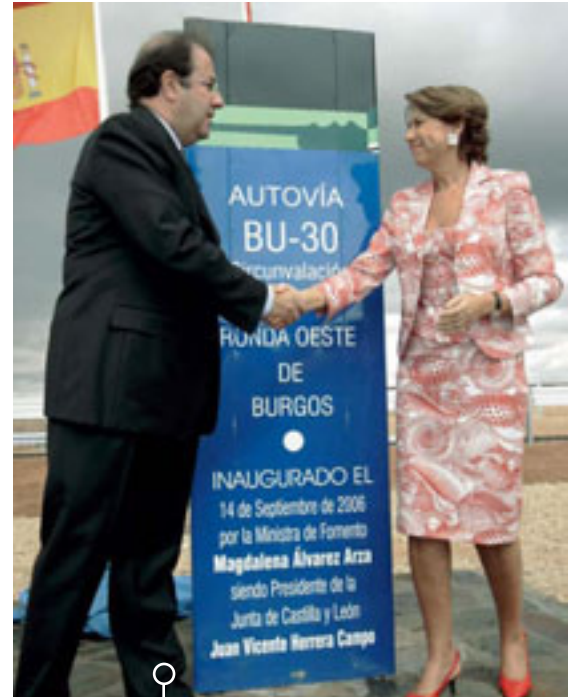
LA MINISTRA de Fomento, Magdalena Álvarez, arriba, y el presidente de la Junta de Castilla y León, Vicente Herrera, durante la inauguración de la BU-30. A la izquierda y abajo, detalles del tramo.

A lo largo del trayecto se han proyectado tres pasos superiores, 12 inferiores y dos enlaces, uno al principio del tramo, en la glorieta, y otro al final, enlace autovía de Castilla, que dispone de cuatro ramales, dos de ellos directos, otro semidirecto y el último tipo lazo.