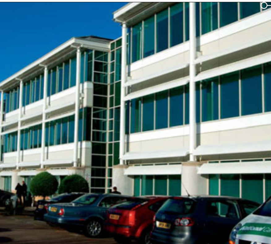
OFICINAS CENTRALES DE LA FILIAL BRITÁNICA de FCC, Waste Recycling Group, en Northampton.