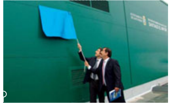
INAUGURACIÓN de las obras del colector general del barrio San Martín por parte del alcalde de Santander, Gonzalo Piñeiro, y el concejal de Medio Ambiente, Íñigo de la Serna.

estación de bombeo del agua excedente de lluvia dotada de seis bombas capaces de elevar un caudal de 8,79 m 3 a una altura manométrica de 2 a 3,5 metros necesarios para entregarla a un canal que desagua en la ría de Raos. Con esta estación se da por finalizado el problema de inundaciones padecidas por el barrio.